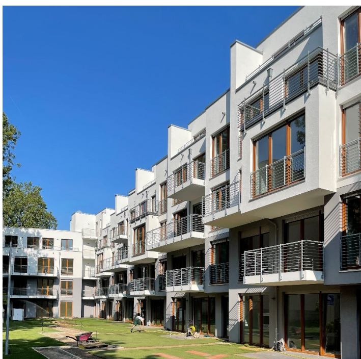
Nybyggeri Dorotheenstrasse 85-87, Düsseldorf

Årsrapporten er fremlagt og godkendt på selskabets ordinære generalforsamling den / 2022